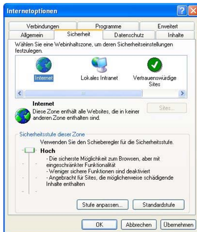
Sicherheitseinstellungen im Internet Explorer